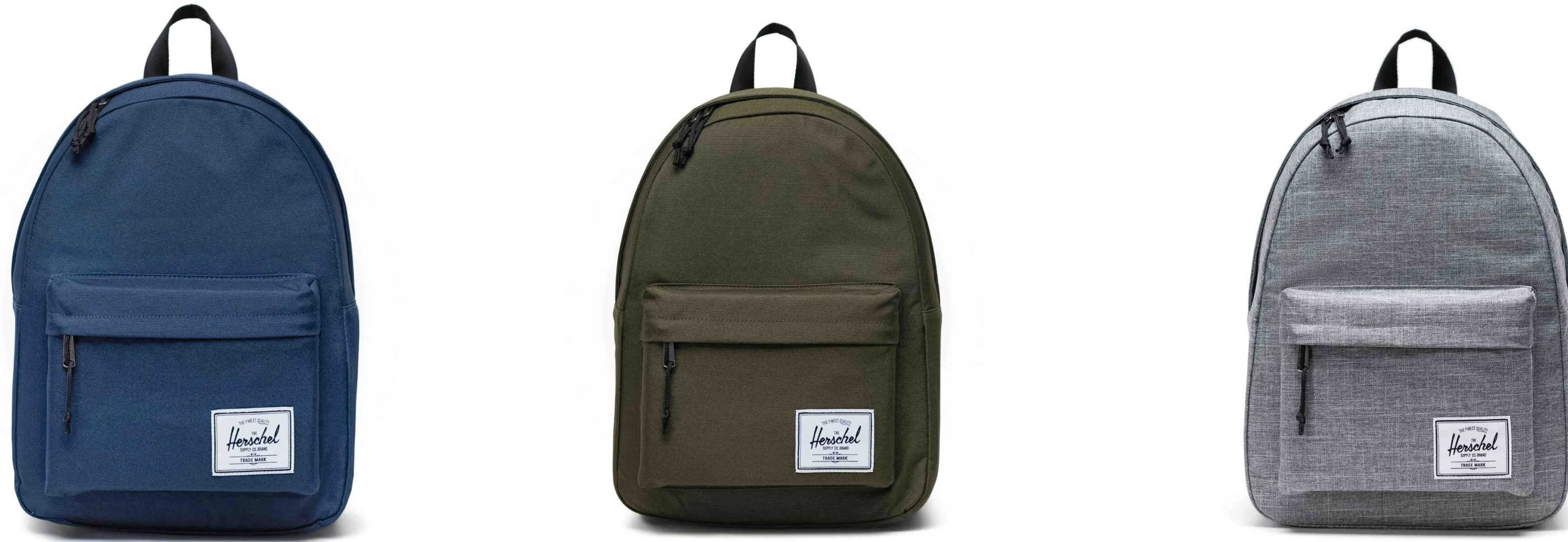
Herschel Classic™ Backpack - 20L