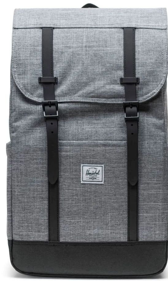
Herschel Retreat™ Backpack - 23L